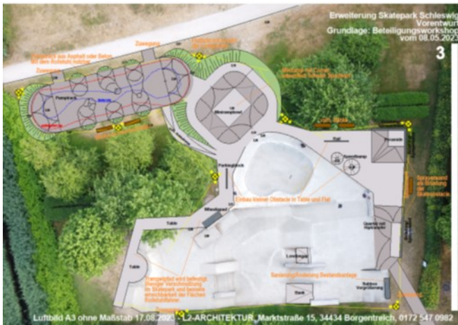
Foto: Planungsentwurf L2-Architekten Stand Grundlage: Beteiligungsworkshop 05/2023

Aktueller Sachstand: Vergabeunterlagen liegen vor, Bauzeit wird auf 3 Monate geschätzt, Umsetzung im Frühjahr 2025, da Bauzeit über kalte Jahreszeit witterungsbedingte Bauunterbrechungen mit sich bringt. Gerade bei dieser Art der Betonbauten kommt es auf eine sehr glatte Oberfläche an.