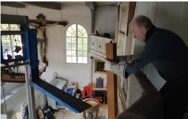
Foto: Ausbau der in 1937 von Furtwängler und Hammer erbauten „alten“ Orgel

Aktueller Sachstand: Ausbau der alten Orgel am 14.10.2024, neue (gebraucht gekaufte) Orgel wird derzeit in der Werkstatt des Orgelbauers in Bordesholm vorbereitet, Einbau im Februar 2025. Im November erfolgt der Einbau der Veranstaltungstechnik.