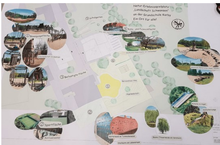
Foto: Mit Kindern und Jugendlichen ausgearbeitetes Konzept