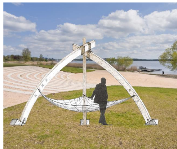
Foto: Animation der Konstruktion aus drei Fundamenten mit einem Tauwerknetzgeflecht.

Die Netzausleger sollen an mehreren Orten in der Region Schlei-Ostsee aufgestellt werden: Kosel, Damp, Winnemark, Boren, Kappeln, Fahrdorf, Schleswig, Borgwedel, Steinberg und Gelting. Durch die gute regionale Verteilung wird ein schleiübergreifender Zusammenhalt vermittelt.