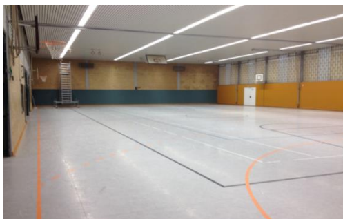
Foto: Der alte Hallenboden in der Turnhalle Tolk

Die Bewilligung erfolgte nach einmaligem Projektauftrag in 2017 für Förderung von Einrichtungen für lokale Basisdienstleistungen.